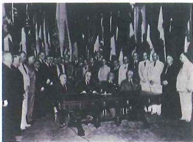
26国代表签署《联合国宣言》