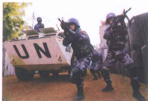
中国第三批赴马里维和部队进行应急反恐演练