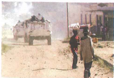
联合国维和部队进驻刚果民主共和国

这支部队不同于一般的军队，它没有战场，没有敌人，是一支政治外交部队。它在执行任务时，除进行自卫外，不得擅自使用武力，必须严守中立，不得卷入冲突中的任何一方，更不能干涉所在国内政。